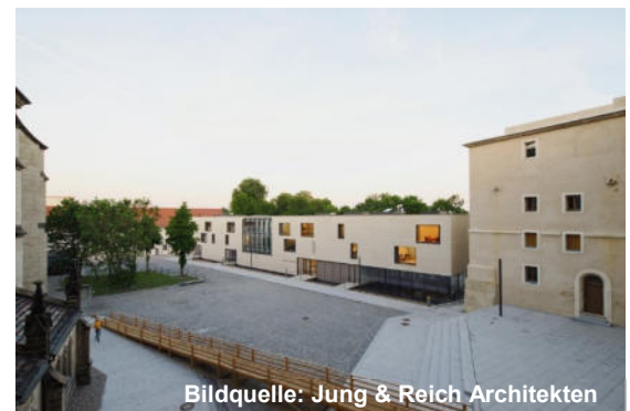
Bildquelle: Jung & Reich Architekten