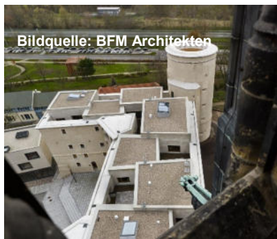
Bildquelle: BFM Architekten